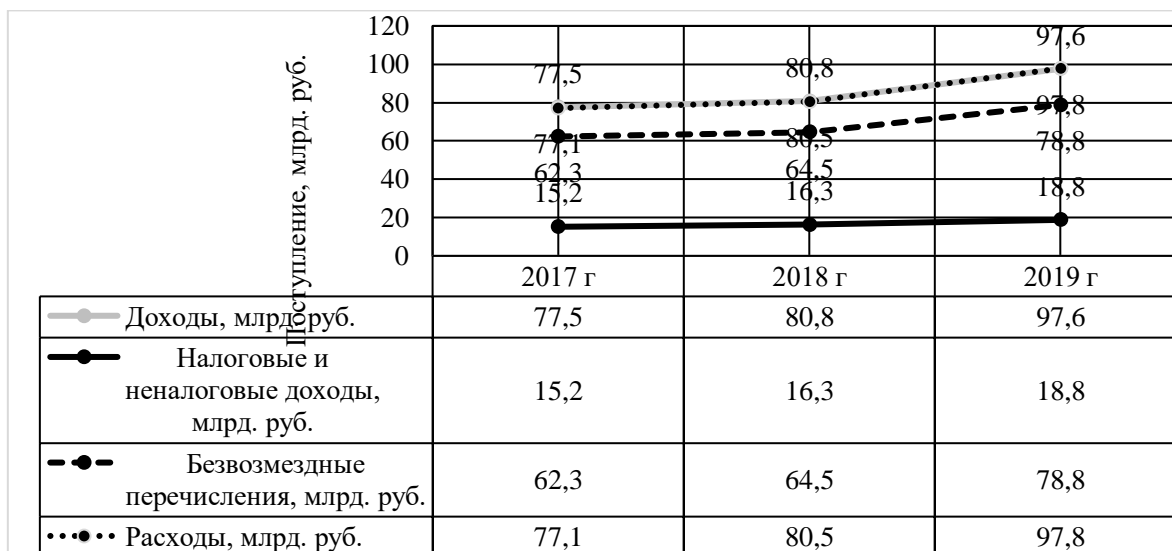
Рис. 3. Динамика консолидированного бюджета Чеченской республики за 2017-2019гг. [по данным 4]

В настоящее время финансовая система Чеченской республики сверхдотационна – почти весь республиканский бюджет формируется безвозмездными поступлениями из Федерального бюджета Российской Федерации (рис. 3).