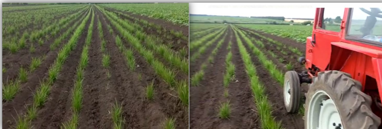
Рисунок 2 – Посевные площади сыти съедобной луговой на хуторе Журавский в Кореновском районе Краснодарского края

В качестве объектов исследования были выбраны клубни сыти съедобной луговой ( Cyperus esculentus L. ). На сегодняшний день единственным производителем данного вида растительного сырья на территории России является фермерское хозяйство, расположенное на хуторе Журавский в Кореновском районе Краснодарского края. Посевные площади этой культуры составляют 5 га (рисунок 2).