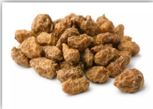
Рисунок 3 – Клубнеплоды сыти съедобной луговой Figure 3. Tigernut's tubers

Клубнеплоды сыти съедобной луговой представлены на рисунке 3. По органолептическим показателям клубнеплоды соответствовали показателям, представленным в таблице 1.