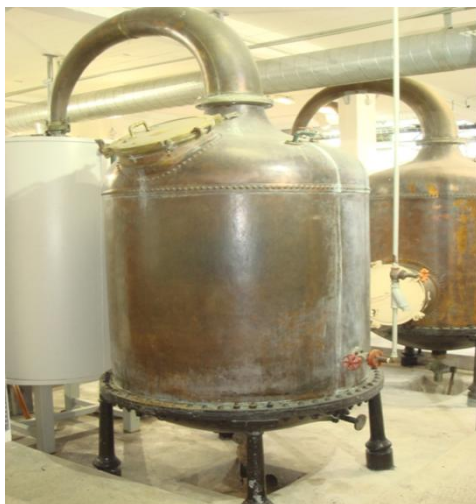
Рисунок 2 – Дистиллятор

При воздействии высоких температур из него выделяются летучие фракции за счет разрушения клеточной структуры растения. Эфирное масло в виде молекул, которые смешаны с молекулами пара, поднимаются по трубке через охлаждающий бак, где они снова принимают жидкое агрегатное состояние. Жидкость, которая собирается в специальном отсеке, – это смесь эфирного масла и воды, она легко разделяется на слои, так как плотность воды и масла различаются. При этом большинство масел будет находиться на поверхности воды, однако существует ряд «тяжелых» масел, которые оседают на дно (например, масло гвоздики). Метод перегонки с водяным паром дает хороший выход эфирных масел в достаточно чистом виде. Помимо этого вода, которая соприкасается с дистиллируемым растением, тоже насыщается небольшим количеством ароматических веществ. Использованная для такого процесса несколько раз вода становится широко известной «розовой» водой, или же лавандовой или любой другой в зависимости от растения, и используется в качестве туалетной воды для ухода за кожей. Однако при всей простоте он недостаточно универсален, так как требуется предварительный подбор индивидуальных условий для каждого растения. Температура, давление, продолжительность дистилляции – все должно быть отрегулировано для достижения оптимального баланса рентабельности процесса и качества масла, поскольку более высокое давление и высокие температуры способны усилить процесс выделения эфирных масел, но могут снизить качество продукта [7].